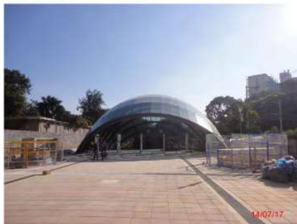
Acesso Principal: Urbanização