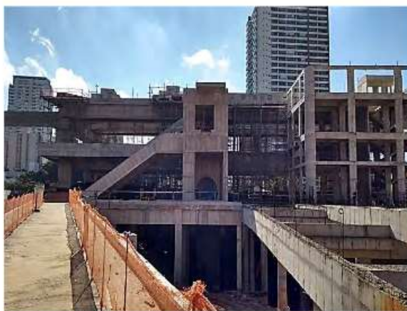
Corpo da Estação.