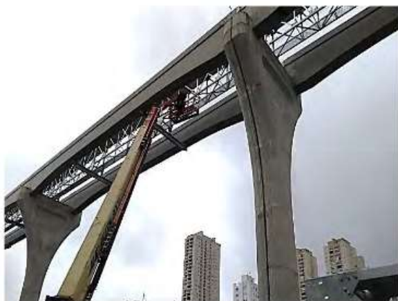
Execução passagem de emergência nas vias.