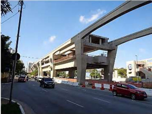
Vista do corpo da Estação.