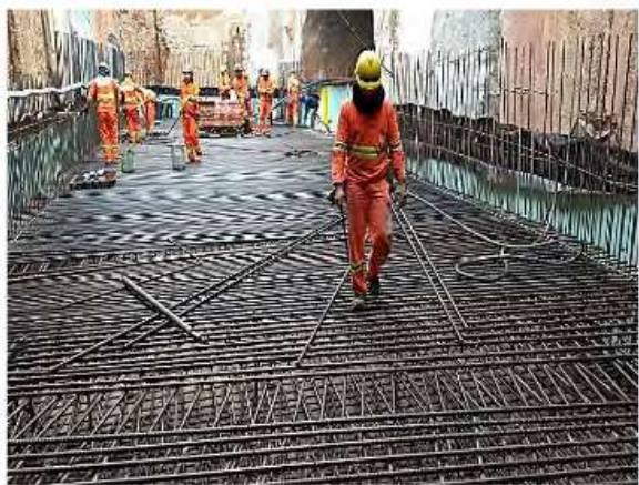
Execução da laje de fundo do VCA do Acesso Aeroporto.