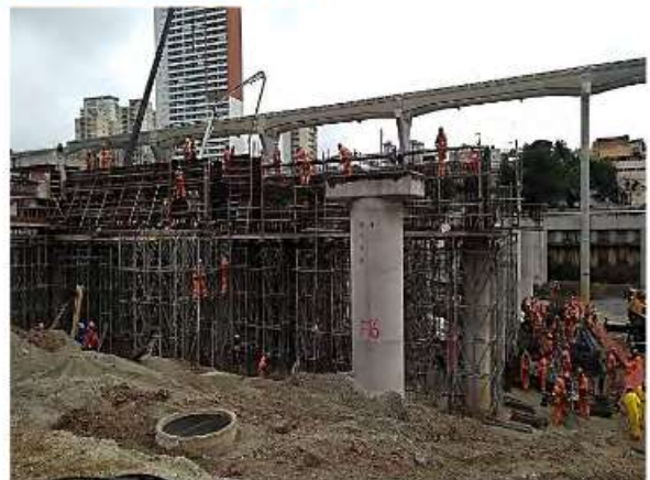
Pátio Água Espaiada – Execução de vigas "in loco".