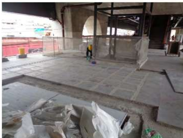
Execução do piso do Mezanino.