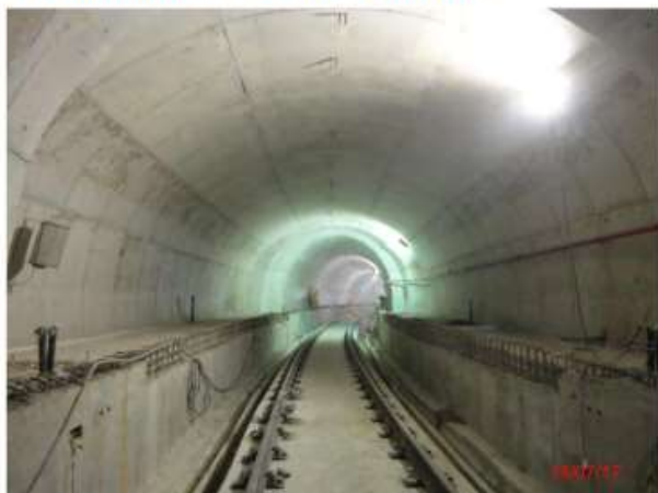
Túnel de estacionamento Via 1: Execução das passarelas de emergência