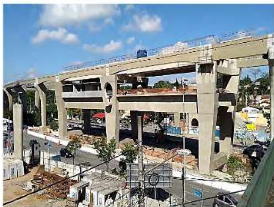
Corpo da Estação.