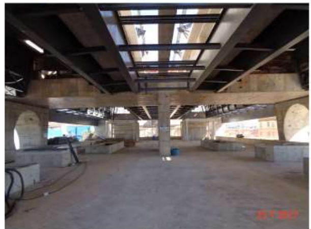
Montagem do Passadiço.