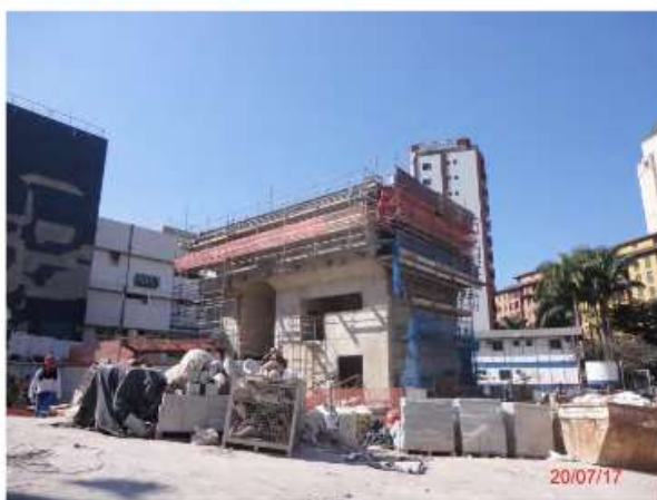
Execução da torre de ventilação e saída de emergência