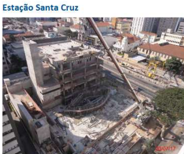
Acesso Principal / Edifício das Salas Técnicas: Vista geral