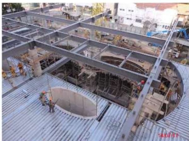
Acesso Sul: Execução das estruturas externas