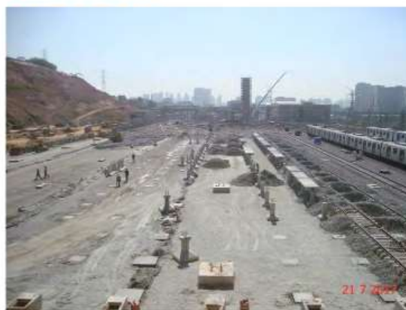
Via Permanente Fase II : Anticontaminante e Sublastro.