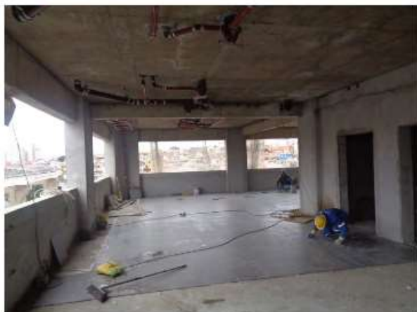
Execução do acabamento das Salas Operacionais