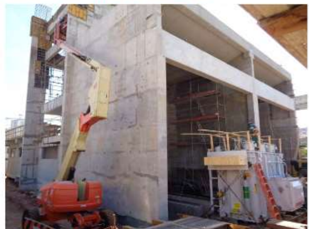
Execução da Obra Civil da Subestação e entrega do primeiro transformador de Alta Tensão.