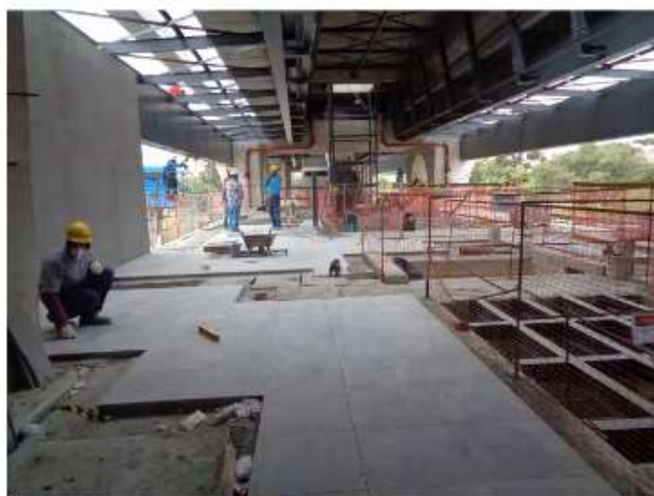
Execução do piso do Mezanino.