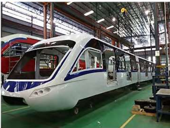
Material Rodante – Contrato em reorganização.