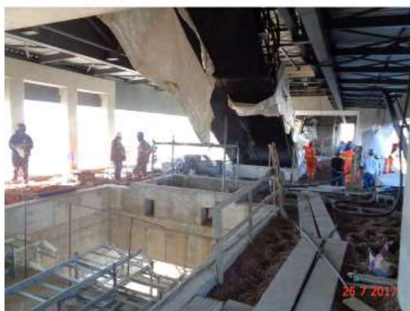
Execução do enchimento do Mezanino.