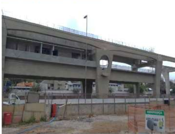
Corpo da Estação.