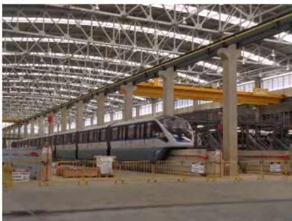
Trens em testes no Pátio Oratório.