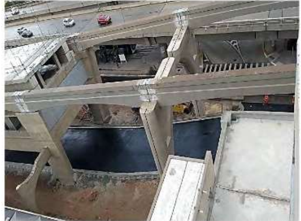
Execução do desvio de tráfego sob o Corpo da Estação