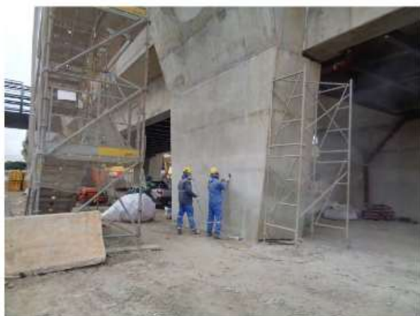
Tratamento do concreto do Corpo da Estação.