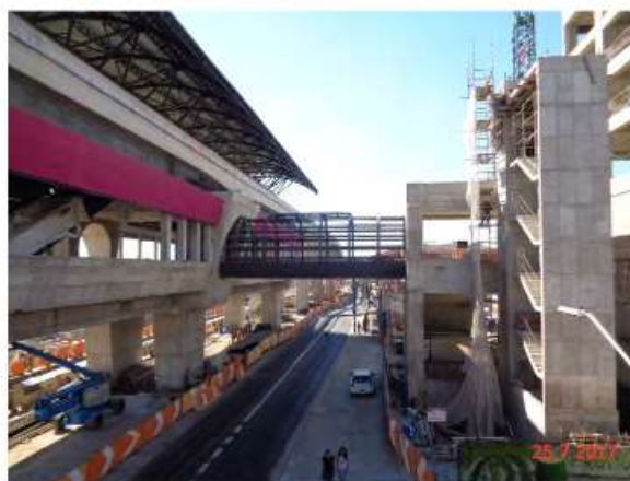
Desforma da estrutura da escada de acesso