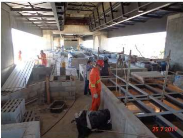
Execução do banco de dutos do Mezanino.