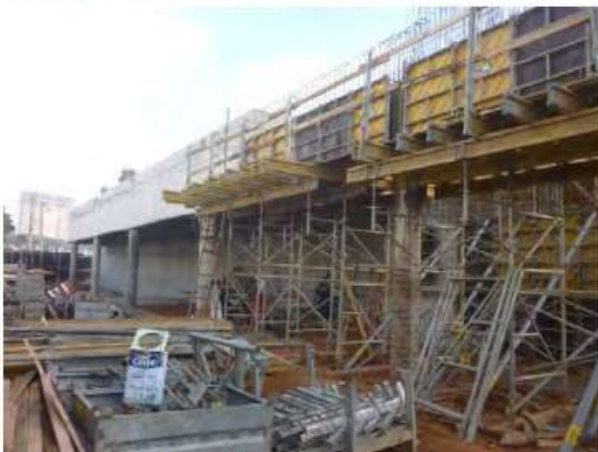
Estrutura do Terminal Sul.